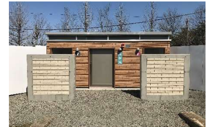
あかねヶ丘公園トイレ（移設後）