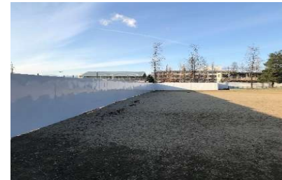
公園・工事エリア境界（仮囲いで区画）