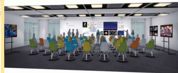
アクティブラーニング室